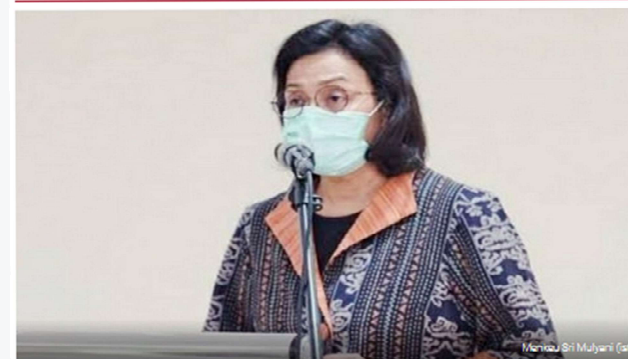
Virtual yang diselenggarakan oleh Dewan Pengurus Pusat Forum